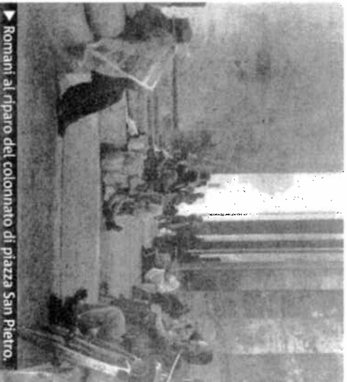
▶ Romani al riparo del colonnato di piazza San Pietro.

▶ Il rifugio. A marzo del 1939 diventa Papa Eugenio Pacelli. Nel giugno del 1940 le SS, tramite informatori nei palazzi pontifici, intercettano una lettera del Cardinale Maglione dove si precisa che sotto Città del Vaticano «il Papa si è fatto costruire un rifugio antiaereo al quale può accedere direttamente in ascensore».